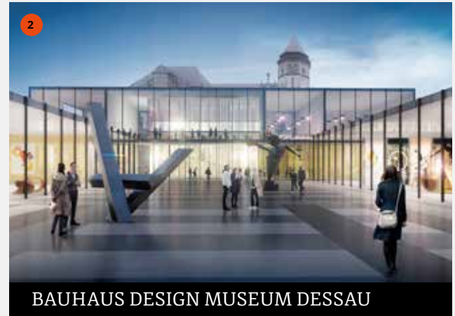
BAUHAUS DESIGN MUSEUM DESSAU