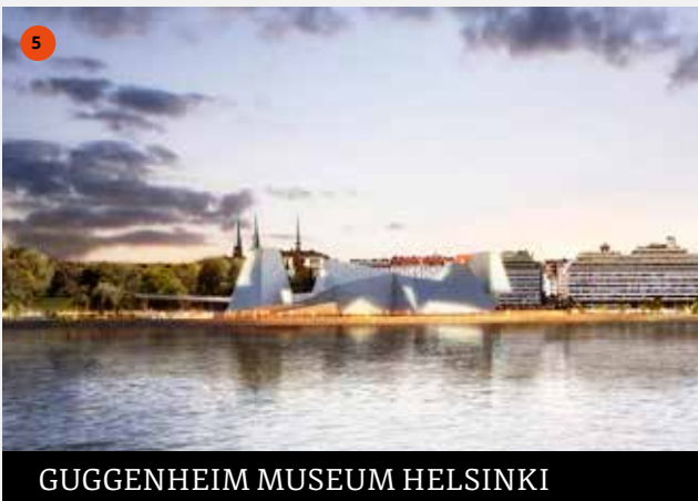
GUGGENHEIM MUSEUM HELSINKI